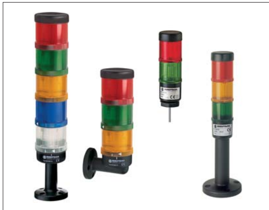
Für die Signalsäulenserien "KombiSIGN" und "Kompakt" besitzt WERMA Patente und konnte daher erfolgreich gegen den chinesische Signalgeräte-Hersteller vorgehen

Auch WERMA sicherte sich die Patentschutzrechte - und damit die Rechte am eigenen Produkt und das Recht am geistigen Eigentum - für ihre Signalsäulen-Serien "KombiSIGN" und "Kompakt". Dieser vorausschauenden Maßnahme ist es zu verdanken, dass WERMA eine einstweilige Verfügung gegen die chinesische Firma erwirken und dessen Aktivitäten innerhalb Deutschlands unterbinden konnte.