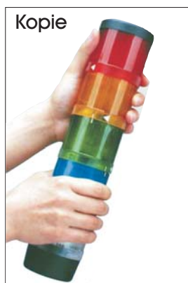
Im direkten Vergleich: Signalsäule von WERMA (links) und Produkte eines chinesischen Herstellers

Durch das „Abkupfern“ innovativer Lösungen oder Designs der Originalhersteller ersparen sich die Raubkopierer eigene Forschungs- und Entwicklungskosten. Zudem profitieren sie von dem Markenimage des Herstellers. Ihre Produkte sind daher wesentlich günstiger. Auch WERMA hat aktuell mit dreisten Produktpiraten zu kämpfen!